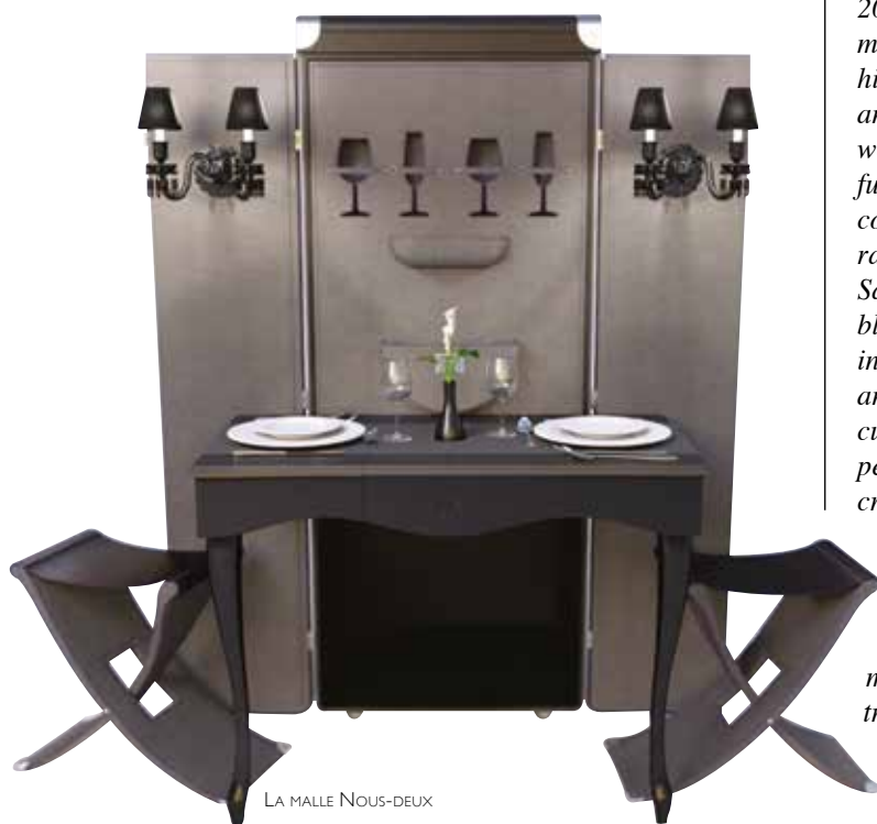
LA MALLE NOUS-DEUX