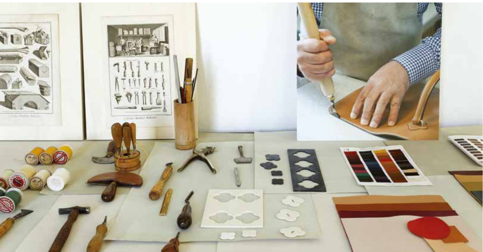
ATELIERS DE LA MAISON MALTIER LE MALLETTIER