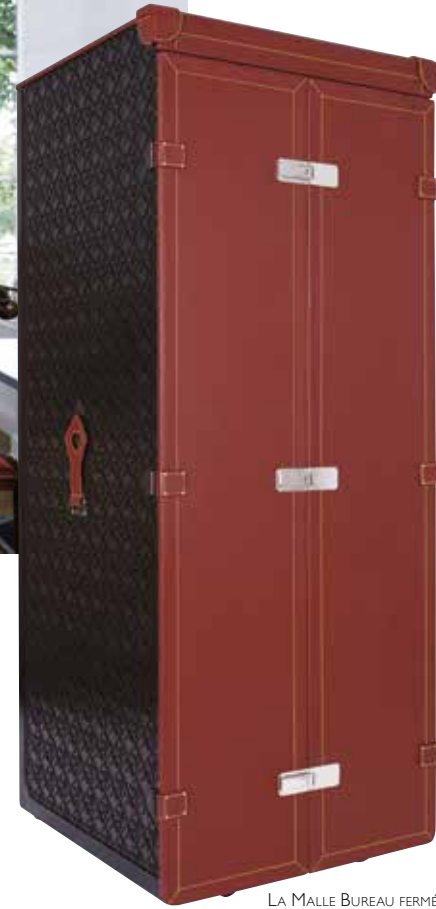
LA MALLE BUREAU FERMÉE